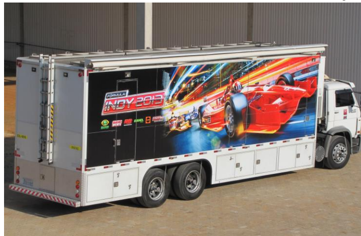
Unidade móvel de produção - EFP