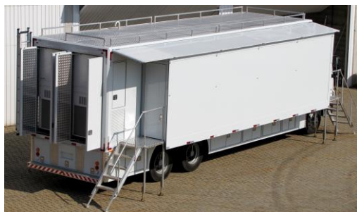
Unidade móvel de produção com Expansão Lateral