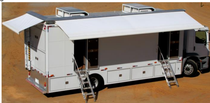
Unidade móvel de produção - EFP