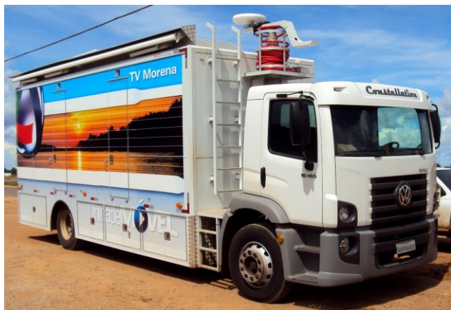
Unidade móvel de jornalismo - SNG