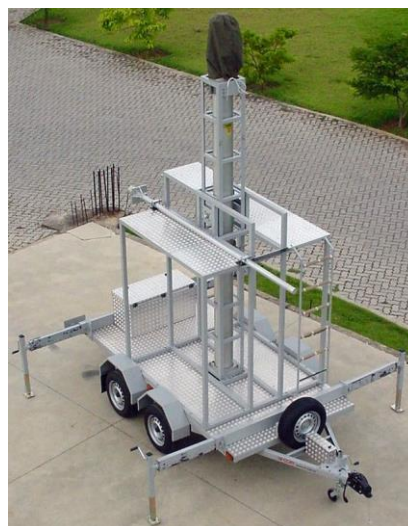
Sistema com mastro 24,3m e braços extensores para os macacos estabilizadores