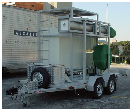
Sistema com mastro 18,3m e BTS Alcatel