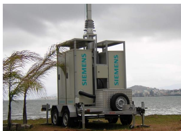
Sistema com mastro 18,3m, BTS Siemens