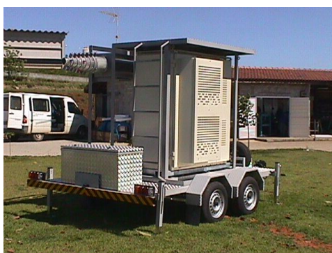
Sistema com mastro 18,3m e ERB Motorola 4812LT