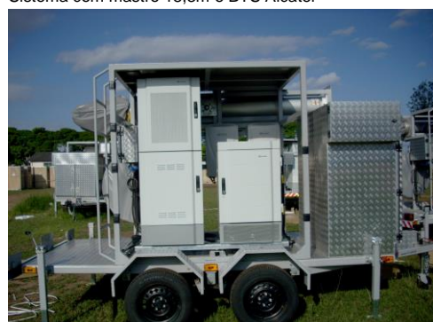
Sistema com mastro 18,3m e ERB Huawei 3G