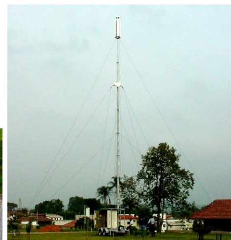
Sistema com mastro 18,3m e ERB Motorola 4812LT, mastro estaiado.