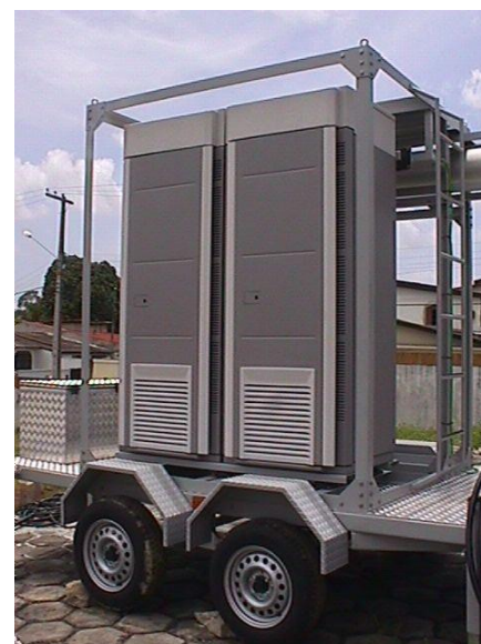
Sistema com mastro 18,3m e ERB Nokia Ultrasite GSM