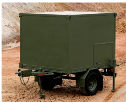
Exemplo de utilização com semirreboque HMT-2000

* Limitada pela capacidade de carga do shelter S-788BR