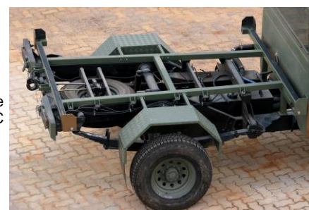
Porta-shelter para transporte em Agrale Marruá AM 23 CC

O Porta-shelter 43924 inclui os pára-lamas e escada de acesso ao shelter