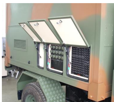
Painéis de conexões