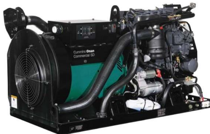
SD 20000 60 Hz