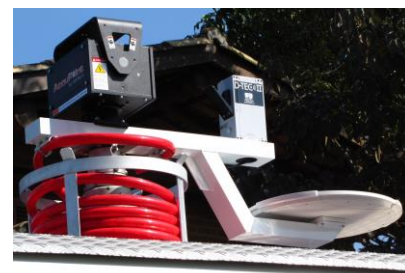
Suporte ("cabide") para AccuPoint/Antena de microondas, DTEC e antena "pizza"