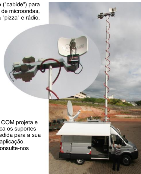
A RF COM projeta e fabrica os suportes sob medida para a sua aplicação. Consulte-nos