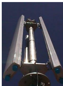
Suporte para antenas painel setorizadas